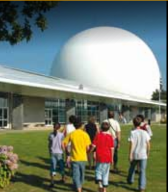
LE VILLAGE GAULOIS