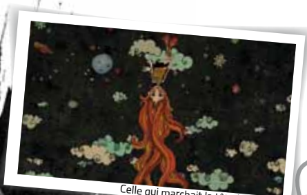
Celle qui marchait la tête à l'envers