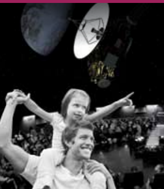
CITÉ DES TÉLÉCOMS